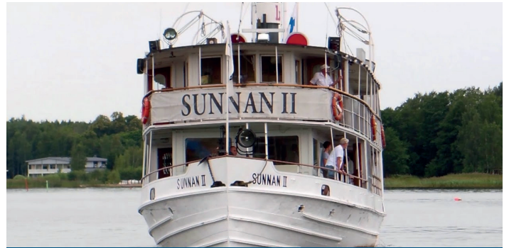
Båtutflykter: Sunnan II Veneretket: Sunnan II