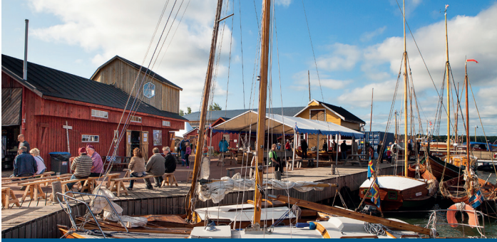
Sjökvarteret: båttillverkning, museum, hantverk Merenkulkukuortteli: veneenrakennus ja museo, käistöitä