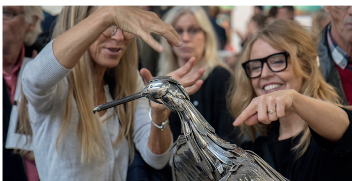
Galleri Skarpans - konstkurs Galleri Skarpans - taidekurssi