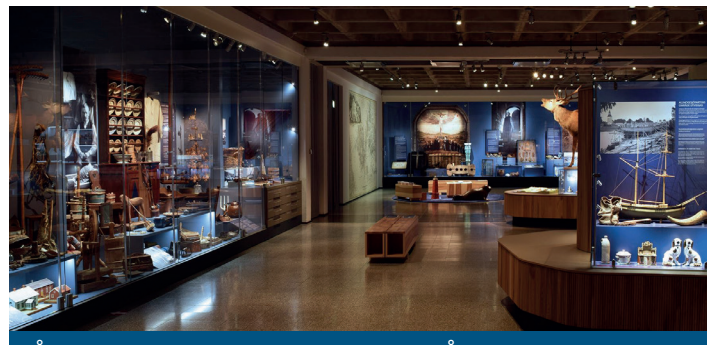
Ålands kulturhistoriska museum och Ålands konstmuseum Ahvenanmaan kulttuurihistoriallinen museo ja Ahvenanmaan taidemuseo