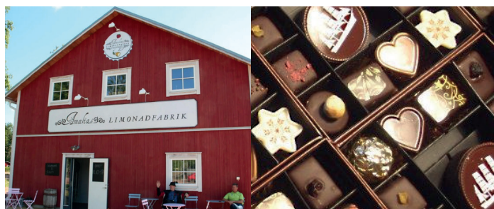
Amalias limonadfabrik och Mercedes chokolaterie - tillverkning och provsmakning Amalia limonaditehdas ja Mercedes chokolaterie - tutustuminen ja koemaistiaiset