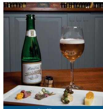
Stallhagen: Bryggeribesök och ölprovning Panimovierailu ja maistiaiset