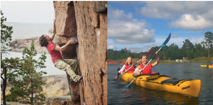
Klättring och paddling Kiipeily ja melonta