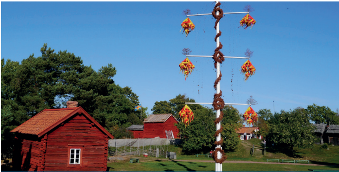
Friluftsmuseet Jan Karlsgården och fångelsemuseet Vita Björn Jan Karlsgården ulkoilmamuseotila ja vankilamuseo Vita Björn

Ahvenanmaalta löytyy paljon näkemistä ja tekemistä. Esimerkiksi pienet yksityiset museot jotka ovat auki yleisölle. Kysy meiltä niin kerromme enemmän