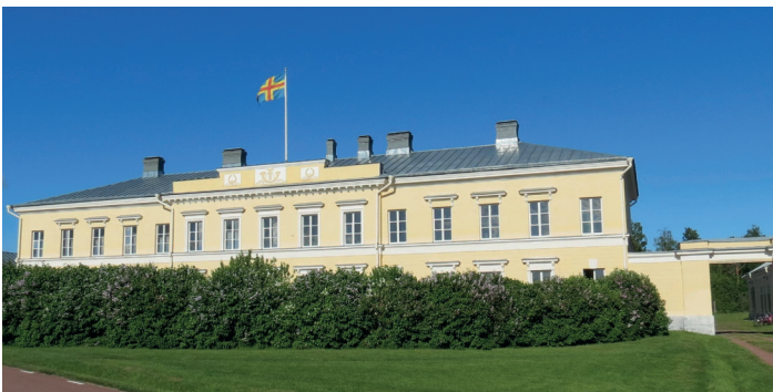
Eckerö Post- och tullhus Eckerö posti- ja tullitalo