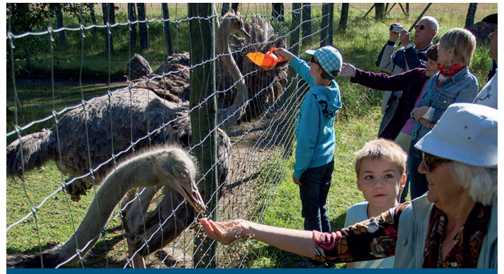
Käringsund viltsafari Käringsundin riistasafari