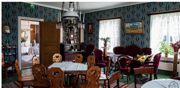
Skeppargården Pellas Pellaksen laivurintalo