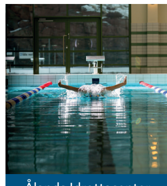
Ålands Idrottscenter simhall / uimahalli