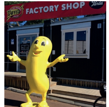
Taffel factory fabriksbesök Taffel factory tehdasvierailu