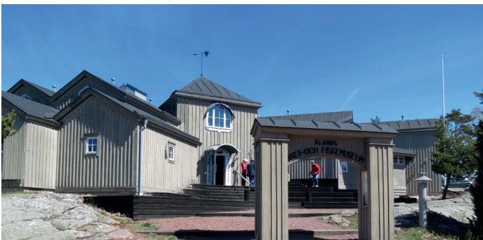
Ålands jakt- och fiskemuseum Ahvenanmaan metsästys- ja kalastusmuseo