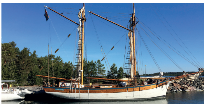
Galeasen Albanus Kaljaasi Albanus