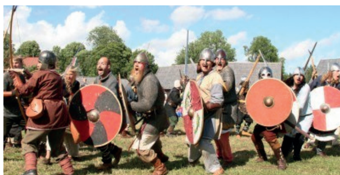
Vikingabyn med vikingalekar Viikinkikylä ja aktiviteetteja