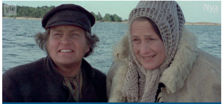
Program för grupper: Stormskärs Maja, i Anni Blomqvists spår Ryhmäohjelma: Myrskyluoden Maija, Anni Blomqvistin jalanjäljissä