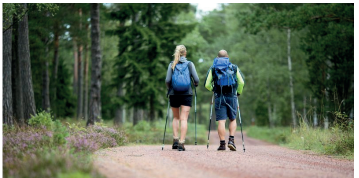
Vandrings- och naturstigar Vaellus- ja luontopolkut