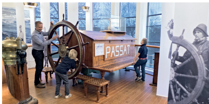
Ålands sjöfartsmuseum med segelfartyget Pommern Ahvenanmaan merikulkumuseo ja purjehduslaiva Pommern