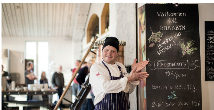
Smakbyn - dryckesprovning och kockskola Smakbyn - juomamaistiaiset ja ruuanlaitto