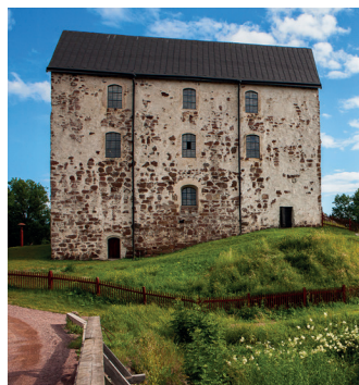
Kastelholms slott Kastelholman linna